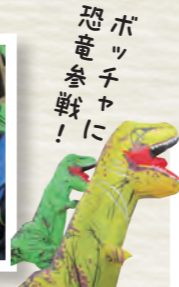
恐竜 ボッチャ 参戦に 挑戦!