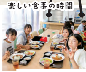
楽しい食事の時間