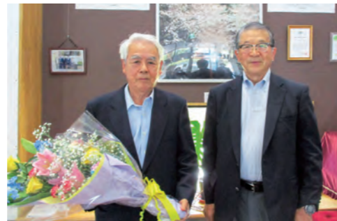
▼三瓶前監事退任による花束贈呈