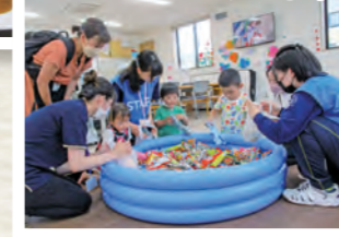
お菓子の つかみどり