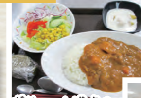
ポリューム満点の カレーライス